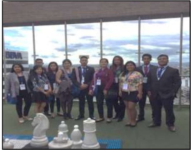
La delegación estudiantil de la FCC-UNMSM en el IV Congreso Latinoamericano de Estudiantes de Contaduría y Administración-Contad - Colombia