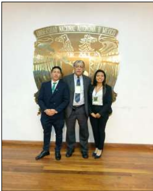
La delegación estudiantil de la FCC-UNMSM en el XXIV Congreso Internacional de Contaduría, Administración e Informática-UNAM 2019 - México