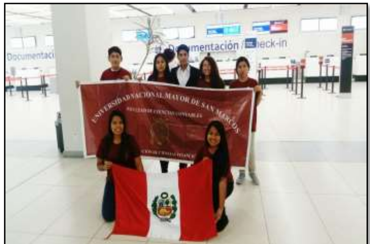
La delegación estudiantil de la FCC-UNMSM en el XXIII Congreso Internacional de Investigación en Ciencias Administrativas-Acacia, México.