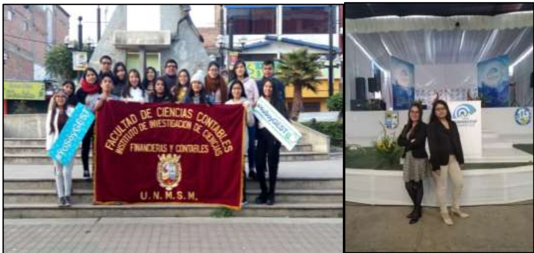
La delegación estudiantil de la FCC-UNMSM en el XXII Congreso Regional del Norte de Estudiantes de Ciencias Contables y Financieras (CORNECCOF – Huaraz.