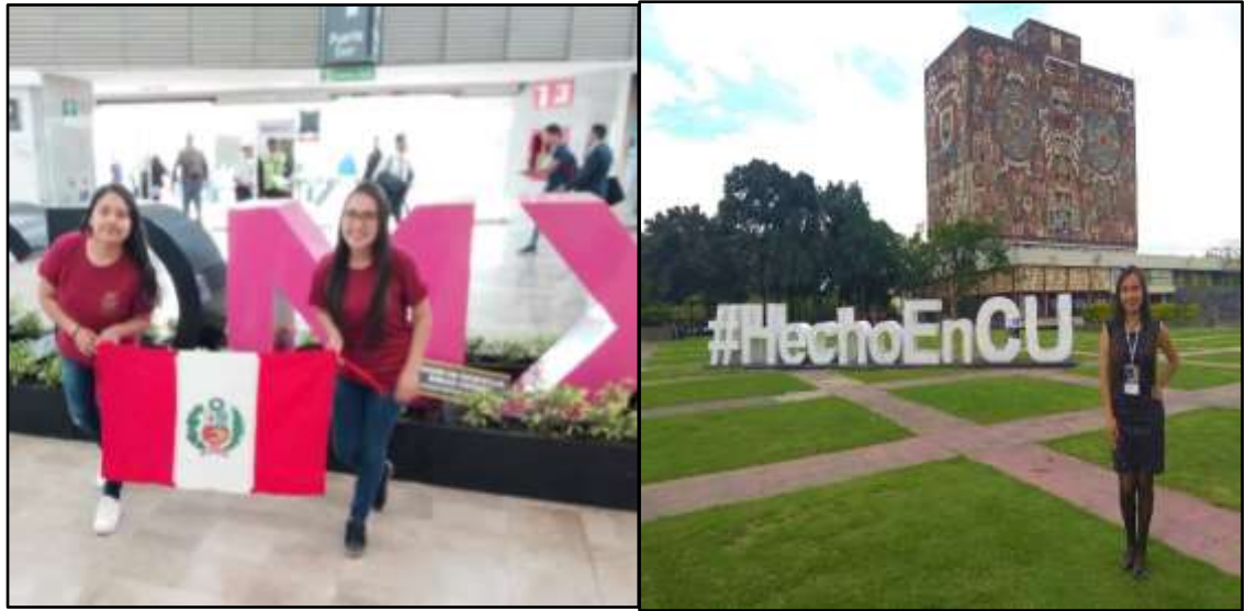
La delegación estudiantil de la FCC-UNMSM en el XXIII Congreso Internacional de Contaduría, Administración e Informática, México.